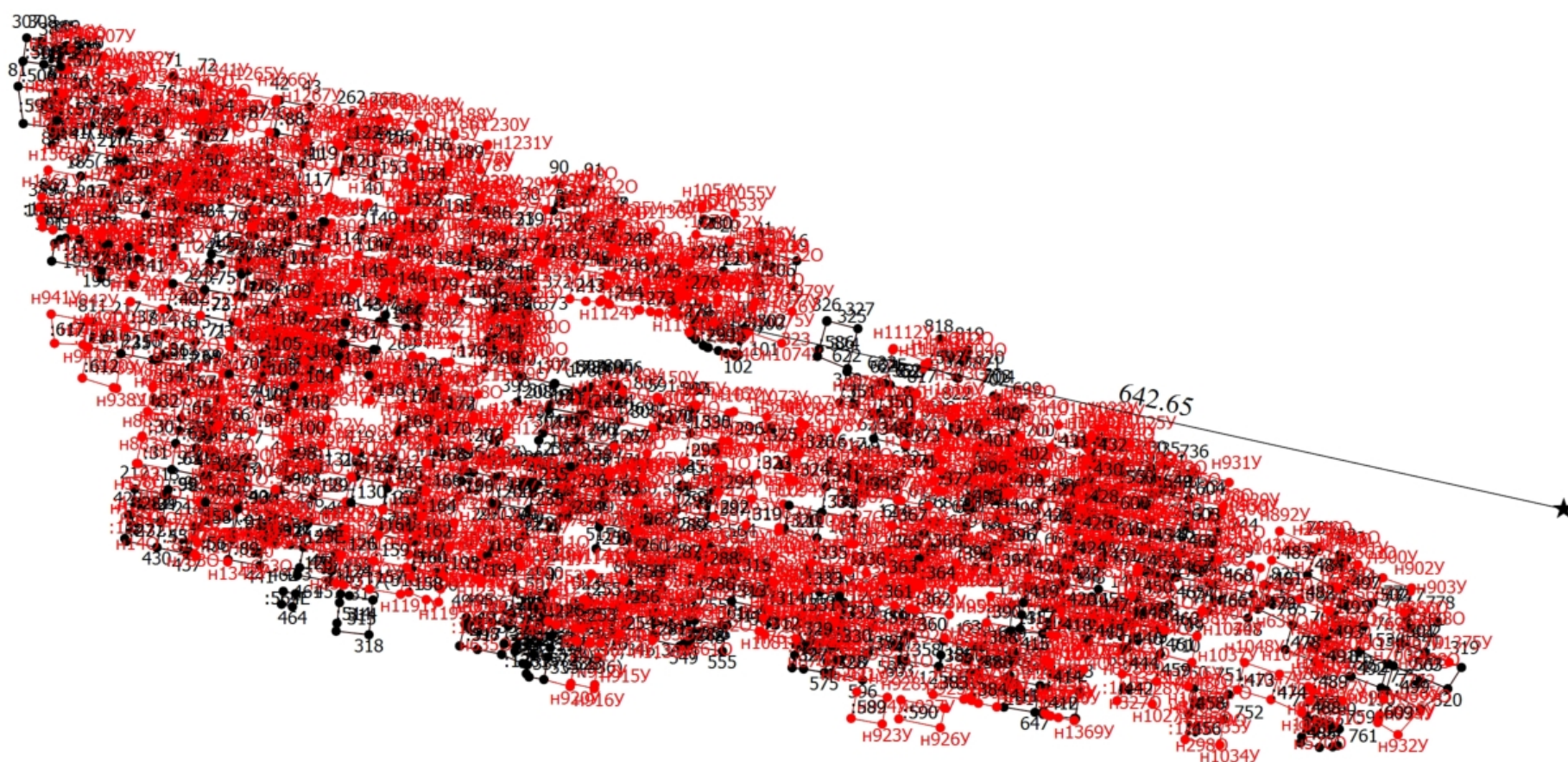
Схема геодезических построений